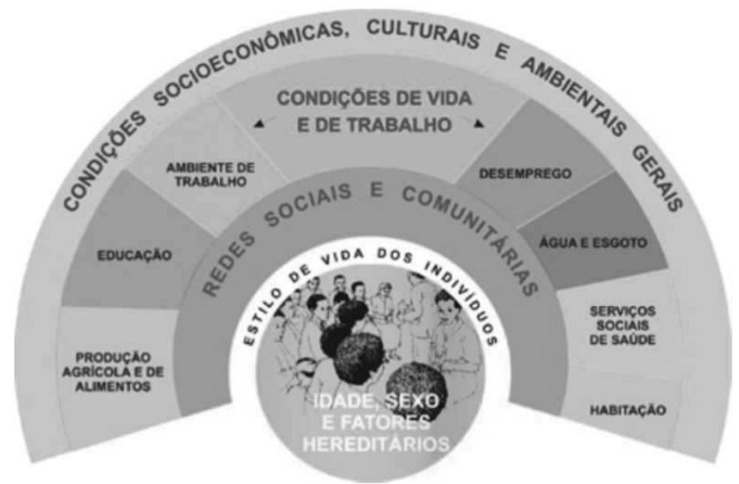
Figura 1 - Determinantes sociais: modelo de Dahlgren e Whitehead

53 - Analise o modelo de Dahlgren e Whitehead sobre os determinantes sociais.